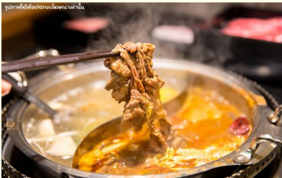
รูปภาพนี้ใช้เพื่อประกอบโฆษณาเท่านั้น

กลางวัน ๒๑ บริการอาหารกลางวัน ณ ร้านอาหาร พิเศษ!!ชาบูสไตล์ไต้หวัน