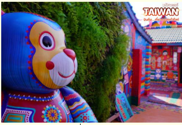
TAIWAN สนุก...เมื่อธรรมชาติโลด

จากนั้น เดินทางสู่หมู่บ้านสายรุ้ง(Rainbow Village) เป็นหมู่บ้านเก่าของทหารผ่านศึกในยุคสงครามกลางเมืองของจีนที่ลี้ภัยมาอยู่กันที่ไต้หวัน ซึ่งสร้างขึ้นอย่างง่ายจากวัสดุทั่วไป แต่ได้รับการเพ้นท์เป็นลวดลายต่างๆด้วยสีสดใสไปตามผนังและกำแพงในหมู่บ้าน จนเป็นที่สนใจของบุคคลทั่วไปทำให้มีชื่อเสียงจนกลายเป็นแหล่งท่องเที่ยวชื่อดังของเมืองไทจงไปในที่สุด นำท่านเดินทางกลับสู่เมืองหนานโถว ตั้งอยู่ใจกลางของเกาะไต้หวัน โดยเป็นเมืองที่มีขนาดใหญ่ที่สุด และเป็นเมืองเดียวของไต้หวันที่ไม่มีเขตติดต่อกับทะเล(ใช้เวลาเดินทางประมาณ 30 นาที)