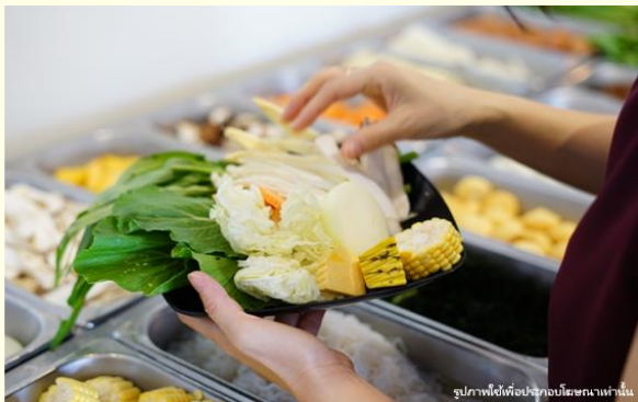
รูปภาพนี้ใช้เพื่อประกอบโฆษณาเท่านั้น

จากนั้น เดินทางสู่หมู่บ้านสายรุ้ง(Rainbow Village) เป็นหมู่บ้านเก่าของทหารผ่านศึกในยุคสงครามกลางเมืองของจีนที่ลี้ภัยมาอยู่กันที่ไต้หวัน ซึ่งสร้างขึ้นอย่างง่ายจากวัสดุทั่วไป แต่ได้รับการเพ้นท์เป็นลวดลายต่างๆด้วยสีสดใสไปตามผนังและกำแพงในหมู่บ้าน จนเป็นที่สนใจของบุคคลทั่วไปทำให้มีชื่อเสียงจนกลายเป็นแหล่งท่องเที่ยวชื่อดังของเมืองไทจงไปในที่สุด นำท่านเดินทางกลับสู่เมืองหนานโถว ตั้งอยู่ใจกลางของเกาะไต้หวัน โดยเป็นเมืองที่มีขนาดใหญ่ที่สุด และเป็นเมืองเดียวของไต้หวันที่ไม่มีเขตติดต่อกับทะเล(ใช้เวลาเดินทางประมาณ 30 นาที)