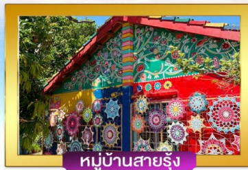
หมู่บ้านสายรุ้ง