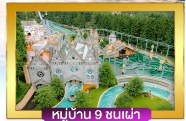
หมู่บ้าน 9 ชนเผ่า

เดินทางโดยสารการบินไชน่าแอร์ไลน์ อาหาร : 6 มื้อ โรงแรม : 4 ดาว