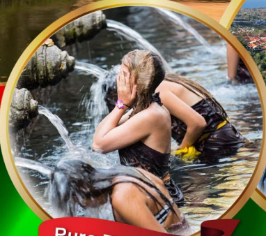
Pura Tirta Empul