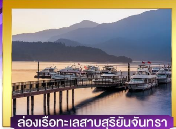
ล่องเรือทะเลสาบสุริยอินจันรา