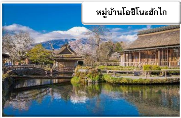
หมู่บ้านโอชิโนะฮักไก

หมู่บ้านโอชิโนะ ฮักไก (Oshino Hakkai Village) เป็นหมู่บ้านที่ตั้งอยู่ใกล้ภูเขาไฟฟูจิ บริเวณทะเลสาบยามานาคาโกะ (Lake Yamanaka-ko) ซึ่งในปี 2013 ฟูจิซังได้รับเลือกให้เป็นมรดกทางวัฒนธรรมของโลก ที่นี้เองก็ได้รับเลือกในฐานะส่วนหนึ่งของฟูจิซังด้วย และเพราะในบริเวณนี้มีบ่อน้ำใสๆ รวมกันกว่า 8 บ่อ ทำให้คนไทยเราเรียกที่นี่ว่า "หมู่บ้านน้ำใส" นั่นเอง