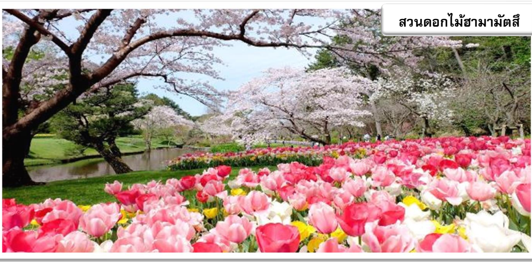
สวนดอกไม้สามมัตสึ