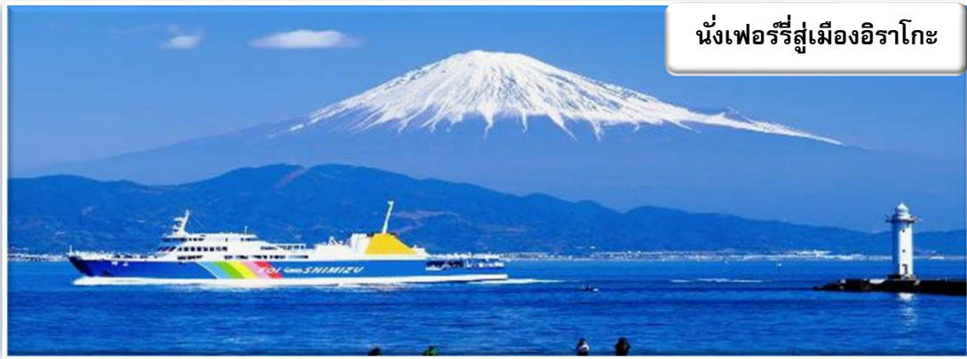
นั่งเฟอร์รี่สู่เมืองอิราโกะ

นำท่าน นั่งเฟอร์รี่สู่เมืองอิราโกะ เรือเฟอร์รี่ข้ามอ่าวชิรุกะนั้นเป็นถนนเส้นทางพิเศษของจังหวัดที่อยู่เหนือน้ำซึ่งจดทะเลเป็นเส้นทางหมายเลข 223 (ซึ่งสามารถอ่านออกเสียงได้ว่า ฟุจิซัง ในภาษาญี่ปุ่น) เรือเฟอร์รี่นี้แล่นข้ามอ่าวชิรุกะ ซึ่งเป็นหนึ่งในอ่าวที่สวยงามที่สุดในโลก และเชื่อมต่อกับท่าเรือชิมิซึและท่าเรือนิชิอิซุโทอิใช้เวลาเดินทาง 70 นาที เพลิดเพลินไปกับทัศนียภาพอันตระการตาของสถานที่มรดกโลกอย่างภูเขาไฟฟูจิและดงสนมิโฮะโนะมัตสึบาระจากห้องรับรองสุดหรู และสุขใจไปกับการล่องเรืออันแสนผ่อนคลายและไม่มีรถติดบนพื้นทะเล