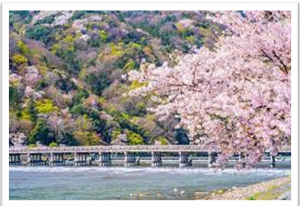
อาราชิยาม่า – สะพานโทเก็ตสึ

เดินทางสู่ อาราชิยาม่า (Arashiyama) สถานที่สุดโรแมนติกที่แม้แต่ชาวญี่ปุ่นเองยังมักจะไปเที่ยวพักผ่อนในวันหยุดเพื่อชื่นชมกับความสวยงามตามธรรมชาติ โดยเฉพาะอย่างยิ่งในช่วงฤดูใบไม้ผลิ การได้มาชื่นชมความสวยงามของดอกซากุระที่ได้รับการคัดเลือกให้เป็นหนึ่งในสถานที่แนะนำสำหรับชมซากุระในเมืองเกียวโต สะพานโทเก็ตสึเคียว ที่มีความยาว 250 เมตร ข้ามแม่น้ำโออิงว่าตั้งอยู่บริเวณเชิงเขาอาราชิยาม่าและยังคงลักษณะเหมือนในคริสต์ศตวรรษที่ 17 แม้จะบูรณะใหม่ด้วยเหล็กแล้วก็ตาม ในฤดูใบไม้ผลิและใบไม้เปลี่ยนสี ยังเป็นอีกสถานที่ที่มีชื่อเสียงในการชมดอกไม้อีกด้วย