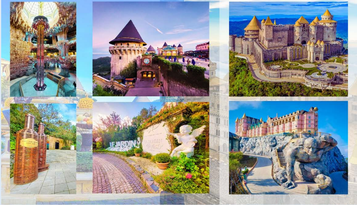
VWDAD43FD-7 เวียดนามกลาง สงกรานต์ บานฉ่า ดานัง ฮอยอัน พักบานาฮิลล์ 4 วัน 3 คืน BY FD 5