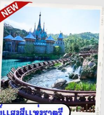
“MOMENTOUS” นวัตกรรมแสงสีแห่งราตรี