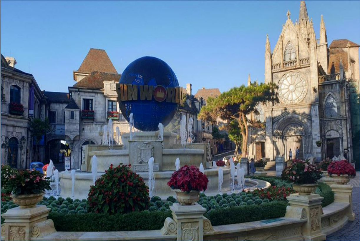
GO1CNXDAD-FD003 ไปแ่วกันเต๊อะ บินตรง..เชียงใหม่ ดานัง ฮอยอัน บานาฮิลล์ (นอนบนบานาฮิลล์ 1 คืน) 3 วัน 2 คืน (FD)