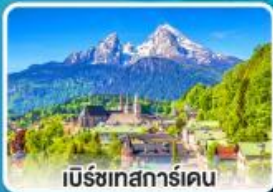
เบิร์ชเทสการ์เดน