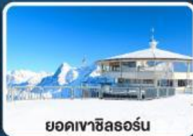
ยอดเขาซิลรอร์น

เข้าชมความสวยงาม พระราชวังเฮเรียนเคียมเซ่ "แวร์ซายน์แห่งเยอรมนี"