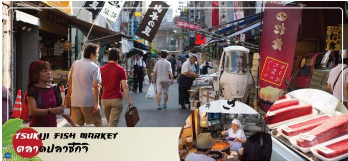
TSUKIJI FISH MARKET ตลาดปลาซึกิ

นำท่านสู่ (ใช้เวลาเดินทางประมาณ 20 นาที) ตลาดสดเก่าแก่แห่งหนึ่งของจังหวัดโตเกียว มีของอร่อยมากมายหลากหลายให้ท่านได้เลือกซื้อแวะชิมความอร่อยกันอย่างจุใจ ภายในตลาดปลา มีร้านทั้งร้านซูชิ แลปลาสดๆ ทั้งปลาทูน่า ปลาแซลมอน เป็นต้น ความอร่อยที่ไม่ควรพลาดอีกมากมายเช่น ไข่หวานย่างชื่อดัง ข้าวหน้าปลาไหล ก๋วยเตี๋ยวเนื้อตุ๋นรสเด็ด ฯลฯ รวมถึงผลไม้ที่ท่านสามารถเลือกซื้อกลับบ้านได้อีกด้วย