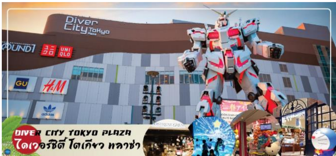
DIVER CITY TOKYO PLAZA ไดเวอร์ซิตี โตเกียว พลาซ่า

จากนั้นเดินทางสู่ อ็อนมอลล์ มาคฮาริ ชินโทชิน (AEON MALL Makuhari Shintoshin) (ใช้เวลาเดินทางประมาณ 45 นาที) ห้างสรรพสินค้าที่นิยมในหมู่นักท่องเที่ยว ภายในตกแต่งในรูปแบบที่ทันสมัยสไตล์ญี่ปุ่น มีร้านค้าที่หลากหลายมากกว่า 150 ร้านจำหน่ายสินค้าแฟชั่น อาหารสดใหม่ และอุปกรณ์ภายในบ้าน นอกจากนี้ยังมีร้านเสื้อผ้าแฟชั่นมากมาย เช่น MUJI, 100 yen shop, Sanrio store, Capcom games arcade และซูปเปอร์มาร์เก็ตขนาดใหญ่