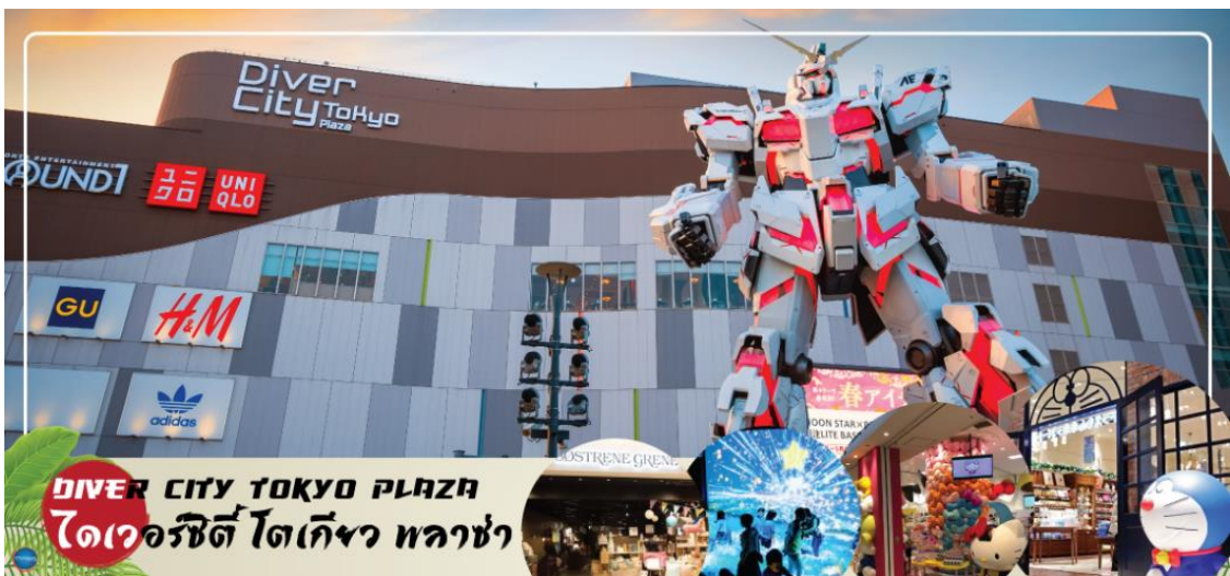
DIVER CITY TOKYO PLAZA ไดเวอร์ซิตี โตเกียว พลาซ่า

เดินทางสู่ กรุงโตเกียว (Tokyo) (ใช้เวลาเดินทางประมาณ 2 ชั่วโมง) เมืองหลวงของประเทศญี่ปุ่น ตั้งอยู่ในภูมิภาคคันโต (Kanto) บนเกาะฮอนชู (Honshu) ในอดีตคือเมืองเอโดะ (Edo) มีรถไฟสายยามาโนเตะ (Yamanote) วนเป็นวงกลมอยู่ใจกลางเมือง มีสถานที่ท่องเที่ยวมากมาย เป็นจุดหมายปลายทางยอดนิยมของนักท่องเที่ยวทั่วโลก จากนั้นเดินทางสู่ ย่านโอไดบะ (Odaiba) เมืองคือเกาะที่สร้างขึ้นไว้เป็นแหล่งช้อปปิ้ง และแหล่งบันเทิงต่างๆ ในอ่าวโตเกียว ได้รับการปรับปรุงให้มีชื่อเสียงและเป็นที่ยอมรับในช่วงหลังของปี 1990 นอกจากนี้มีสถาปัตยกรรมที่สวยงามตั้งอยู่มากมายแล้ว แต่ก็ยังคงความเป็นธรรมชาติไว้ด้วยความอุดมสมบูรณ์ของพื้นที่สีเขียว ไดเวอร์ซิตี โตเกียว พลาซ่า (Diver City Tokyo Plaza) เป็นห้างดังอีกห้างหนึ่ง ที่อยู่บนเกาะ โอไดบะ จุดเด่นของห้างนี้ก็คือ หุ่นยนต์กันดั้ม ขนาดเท่าของจริง ซึ่งมีขนาดใหญ่มาก ในบริเวณห้าง อีสระช้อปปิ้งตามอัธยาศัย