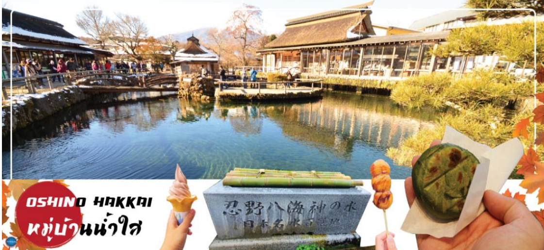
OSHINO HAKKAI หมู่บ้านน้ำใส

นำท่านเดินทางสู่ หมู่บ้านโอชิโนะฮัคไค (Oshino Hakkai) ให้ท่านเจาะลึกตามหาแหล่งน้ำบริสุทธิ์จากภูเขาไฟฟูจิ ที่เป็นแหล่งน้ำตามธรรมชาติตั้งอยู่ในหมู่บ้านโอชิโนะ จ.ยามานาชิ หรือพูดในทางกลับกันคือกลุ่มน้ำผุดโอชิโนะฮัคไค เพียงก้าวแรกที่ย่างเท้าเข้าไปในหมู่บ้านก็สัมผัสได้ถึงอากาศบริสุทธิ์ และไอเย็นจากแหล่งน้ำธรรมชาติที่มีให้เห็นอยู่ทุกมุม โดยในบ่อน้ำใสแจ๋วมีปลาหลากหลายพันธุ์แหวกว่ายอย่างสบายอารมณ์ แต่ขอบอกเลยว่าน้ำแต่ละบ่อนั้นเย็นจับใจจนแอบสงสัยว่าน้องปลาไม่หนาวสะท้านกันบ้างหรือ เพราะอุณหภูมิในน้ำเฉลี่ยอยู่ที่ 10-12 องศาเซลเซียสนอกจากชมแล้วก็ยังมีน้ำผุดจากธรรมชาติให้ดื่กดื่มตามอัธยาศัย และที่สำคัญ หมู่บ้านโอชิโนะยังเป็นแหล่งช้อปปิ้งสินค้าโอท็อปชั้นเยี่ยมอีกด้วย