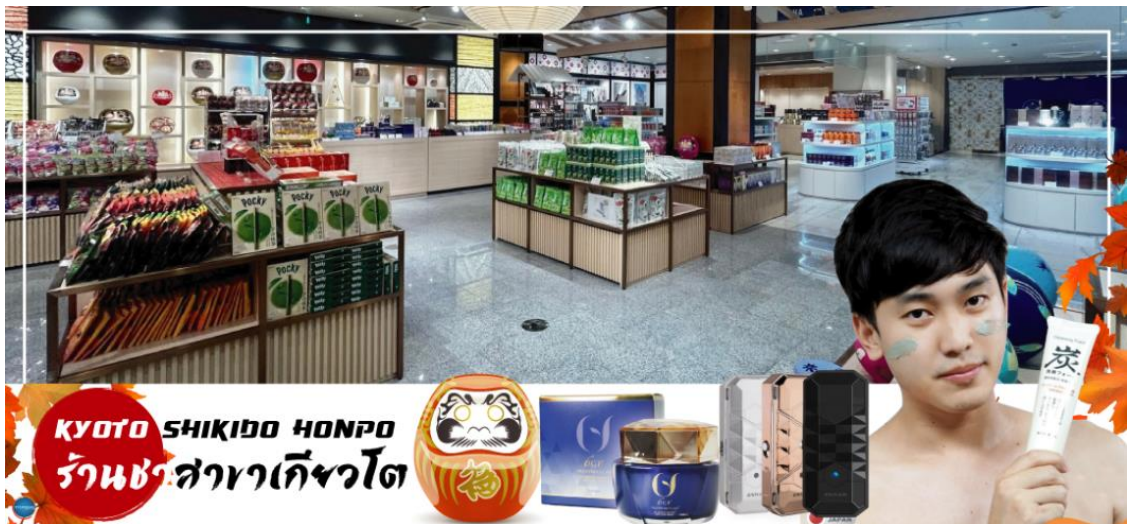
KYOTO SHIKIDO HONPO ร้านชาสาวาเกียวโต

เที่ยง รับประทานอาหารกลางวัน ณ ภัตตาคาร (5)