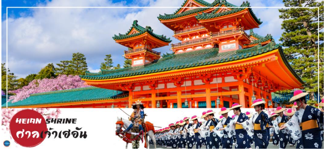
HEIAN SHRINE ศาลเจ้าเฮอัน

วันที่สี่ เมืองนาโกย่า – เมืองเกียวโต – ศาลเจ้าเฮอัน – การเรียนพิธีชงชาญี่ปุ่น – เมืองโอซาก้า – เอ็กซ์โปซิติ – ช้อปปิ้งชินไซบาชิ