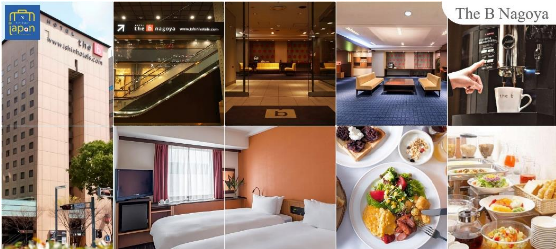
The B Nagoya

พักที่ HOTEL THE B NAGOYA หรือเทียบเท่าระดับเดียวกัน