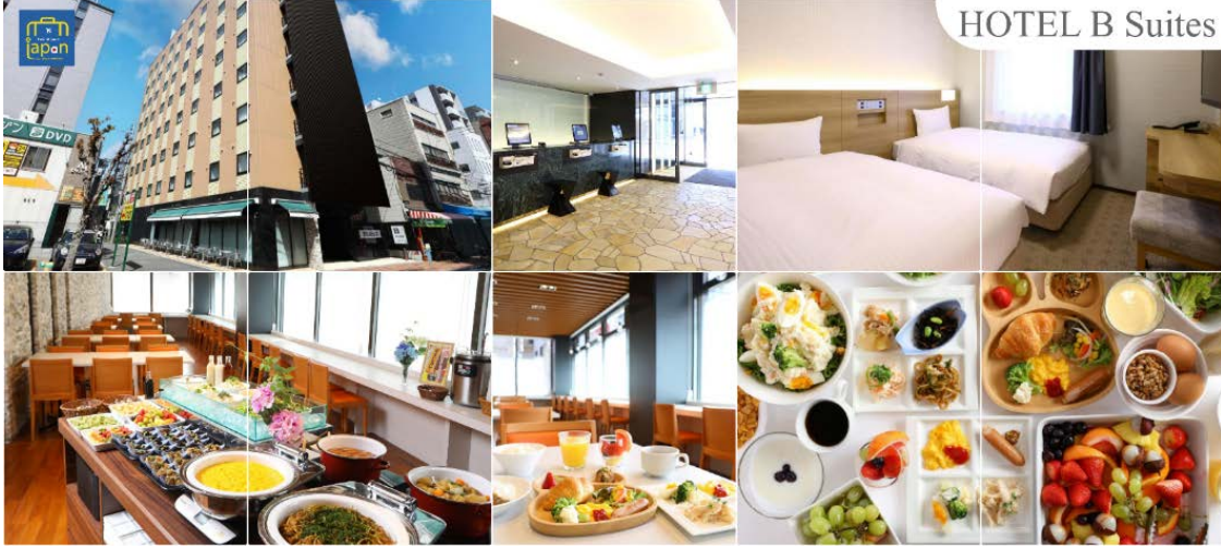
HOTEL B Suites

พักที่ HOTEL B SUITES NAMBA, OSAKA หรือเทียบเท่าระดับเดียวกัน