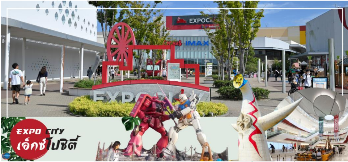
EXPO CITY เอ็กซ์โปซิติ

เที่ยง รับประทานอาหารกลางวัน ณ ภัตตาคาร (7)