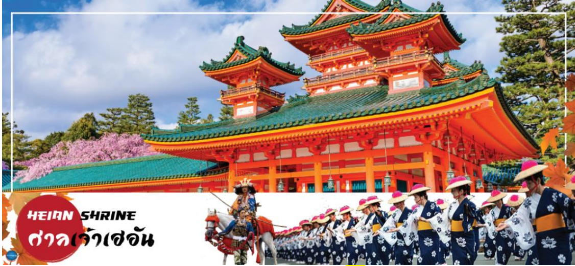
HEIAN SHRINE ศาลเจ้าเฮอัน

วันที่ทำ เมืองนาโกย่า – เมืองเกียวโต – ศาลเจ้าเฮอัน – การเรียนพิธีชงชาญี่ปุ่น – เมืองโอซาก้า – เอ็กซ์โปซิติ – ซ้อปิ้งชินไซบาชิ