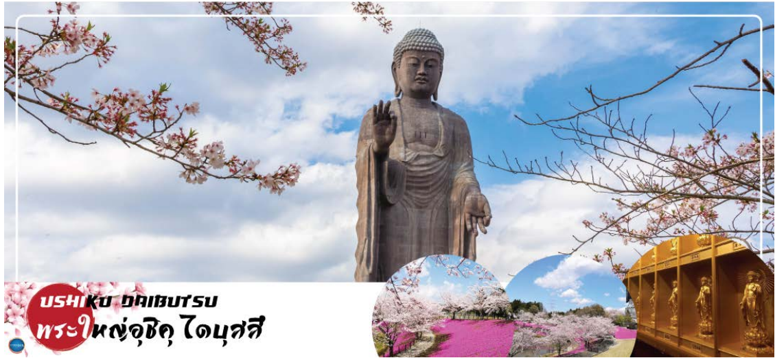
USHIKU DAIBUTSU พระใหญ่อุซึกุ ไดบุตสึ

นำท่านนมัสการ พระใหญ่อุซึกุ ไดบุตสึ (Ushiku Daibutsu) (ใช้เวลาเดินทางประมาณ 50 นาที) เป็นพระพุทธรูปปางยืนที่สูงที่สุดของประเทศญี่ปุ่น และเคยเป็นรูปปั้นที่สูงที่สุดในโลกที่ถูกบันทึกไว้ โดยหนังสือบันทึกสถิติโลกกินเนสบุ๊ค (Guinness Book of world records) เมื่อปี ค.ศ. 1995 ด้วยความสูงถึง 120 เมตร ทำให้สามารถมองเห็นได้ตั้งแต่ใจกลางเมืองโตเกียวเลยทีเดียว สามารถเข้าไปยังบริเวณภายในรูปปั้นและขึ้นไปยังจุดที่เป็นหอสังเกตการณ์ในระดับความสูงที่ 85 เมตร ซึ่งจะอยู่ตรงส่วนของหน้าอกพระพุทธรูป เป็นจุดที่สามารถมองเห็นวิวในมุมด้านกว้างได้ ทั้งหมด บนชั้นนี้จะมีกระจกที่เป็นช่องหน้าต่างอยู่ด้วยกัน 4 ด้าน และมองเห็นภูเขาไฟฟูจิได้จากรมนี้อีกด้วย (ราคาไม่รวมค่าเข้าพระพุทธรูปด้านใน) บริเวณใกล้เคียงจะมีสวนขนาดใหญ่เนื่องจากต้นไม้ในสวนส่วนมากเป็นต้นซากุระ ในช่วงที่ซากุระบานที่นี่จึงสวยงามเป็นพิเศษ เรียกได้ว่ามาไหว้พระอย่างเดียวก็อิ่มบุญแล้ว แถมยังได้อิมใจไปกับวิวสวยๆอีกด้วย (จุดชมซากุระขึ้นกับภูมิอากาศ) นำท่านเดินทางสู่ เมืองนาริตะ (ใช้เวลาเดินทางประมาณ 40 นาที)