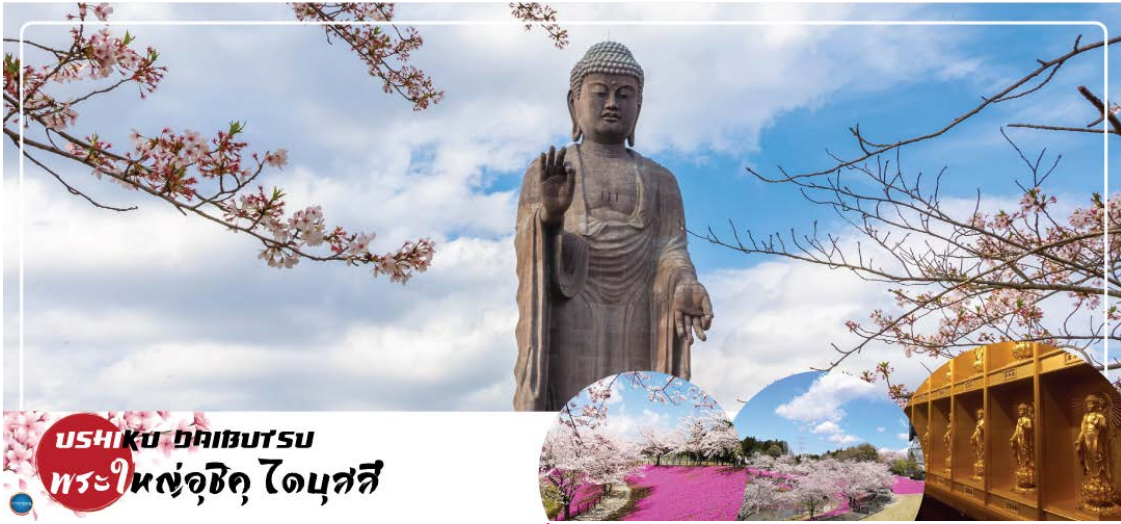
USHIKU DAIBUTSU พระใหญ่อุซึกุ ไดบุตสึ

นำท่านนมัสการ พระใหญ่อุซึกุ ไดบุตสึ (Ushiku Daibutsu) (ใช้เวลาเดินทางประมาณ 50 นาที) เป็นพระพุทธรูปปางยืนที่สูงที่สุดของประเทศญี่ปุ่น และเคยเป็นรูปปั้นที่สูงที่สุดในโลกที่ถูกบันทึกไว้ โดยหนังสือบันทึกสถิติโลกกินเนสบุ๊ค (Guinness Book of world records) เมื่อปี ค.ศ. 1995 ด้วยความสูงถึง 120 เมตร ทำให้สามารถมองเห็นได้ตั้งแต่ใจกลางเมืองโตเกียวเลยทีเดียว สามารถเข้าไปยังบริเวณภายในรูปปั้นและขึ้นไปยังจุดที่เป็นหอสังเกตการณ์ในระดับความสูงที่ 85 เมตร ซึ่งจะอยู่ตรงส่วนของหน้าอกพระพุทธรูป เป็นจุดที่สามารถมองเห็นวิวในมุมด้านกว้างได้ ทั้งหมด บนชั้นนี้จะมีกระจกที่เป็นช่องหน้าต่างอยู่ด้วยกัน 4 ด้าน และมองเห็นภูเขาไฟฟูจิได้จากรองนี้อีกด้วย (ราคาไม่รวมค่าเข้าพระพุทธรูปด้านใน) บริเวณใกล้เคียงจะมีสวนขนาดใหญ่เนื่องจากต้นไม้ในสวนส่วนมากเป็นต้นซากุระ ในช่วงที่ซากุระบานที่นี่จึงสวยงามเป็นพิเศษ เรียกได้ว่ามาไหว้พระอย่างเดียวก็อิ่มบุญแล้ว แถมยังได้อิมใจไปกับวิวสวยๆอีกด้วย (จุดชมซากุระขึ้นกับภูมิอากาศ) (ราคาไม่รวมค่าเข้าชมสวน) นำท่านเดินทางสู่ เมืองนาริตะ (ใช้เวลาเดินทางประมาณ 40 นาที)