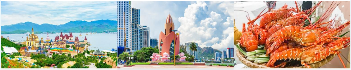
VinWonders NHA TRANG Tram Huong Tower Nha Trang Night Market

*ทางบริษัทฯ ขอสงวนสิทธิ์ในการสลับโปรแกรมทัวร์ตามความเหมาะสมขึ้นอยู่กับสถานการณ์หน้างาน โดยคำนึงถึงผลประโยชน์ของลูกค้าเป็นหลัก