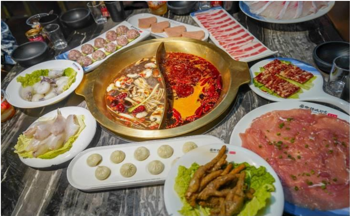
GO1TFU-MU112 เฝิงตุ หวงหลง จี๊วจ้ายโกว ดูหมี่แพนด้า 6วัน 5คืน โดยสายการบิน China Eastern (MU)