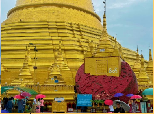
นำคณะเดินทางสู่ เมืองไจ้กัทย็ (Kyaikhtyo) ใช้เวลาเดินทางประมาณ 2-3 ชั่วโมง