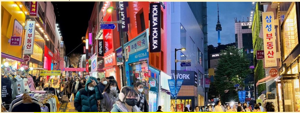
**อิสระทานอาหารค่ำ มีอาหารหลากหลายให้ท่านเลือกทาน***