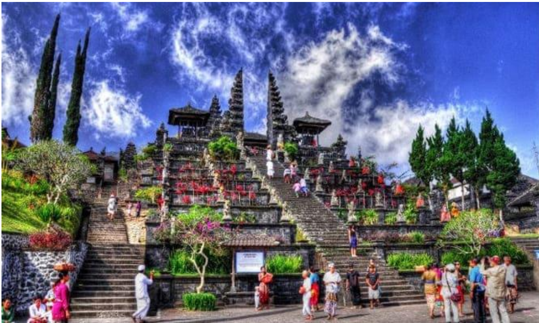
**** หากมีการแจ้งเตือนภัยภูเขาไฟ ขอสงวนสิทธิ์ในการปรับเปลี่ยนวัดบาตอร์แทน ****