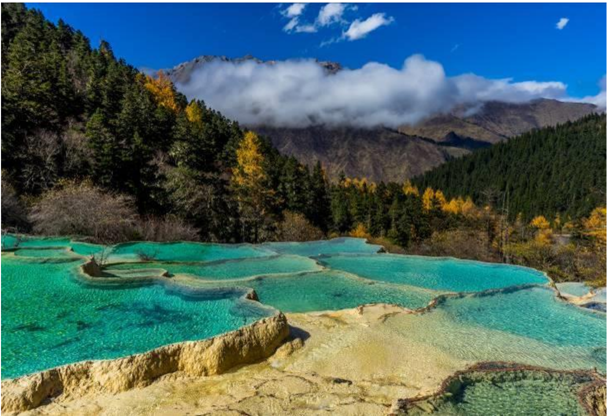
GO1TFU-MU333 เฉิงตู จั๋วจั๋ยไกว หวงหลง สี่ตรูณี ดูหมี่แพนต้า 8วัน 7คืน โดยสายการบิน China Eastern (MU)

หมายเหตุ ** ราคา รวมนั่งกระเช้าไฟฟ้าหวงหลงขึ้น+รถแบริดเตอร์แล้ว อย่างละ 1 ขา หากท่านต้องการนั่งกระเช้าขาลงต้องชำระเพิ่มประมาณ 100 หยวน *** ในกรณีที่สภาพอากาศไม่ดี กระเช้าและรถแบริดเตอร์ไม่เปิดให้บริการ ทางบริษัทขอคืนเงินให้ท่านละ 60 หยวน ***