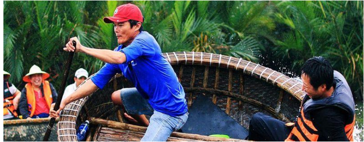
ชมการแสดง หมุนกระดัง ถือเป็นการแสดงที่ทุกคนไม่ควรพลาดมาที่นี่ และใครอยากทดสอบความอดทนในการหมุนเรือก็แจ้งคนพายเรือได้เลย

รับประทานอาหารกลางวัน ณ เมนูกุ้งลือบสเตอร์