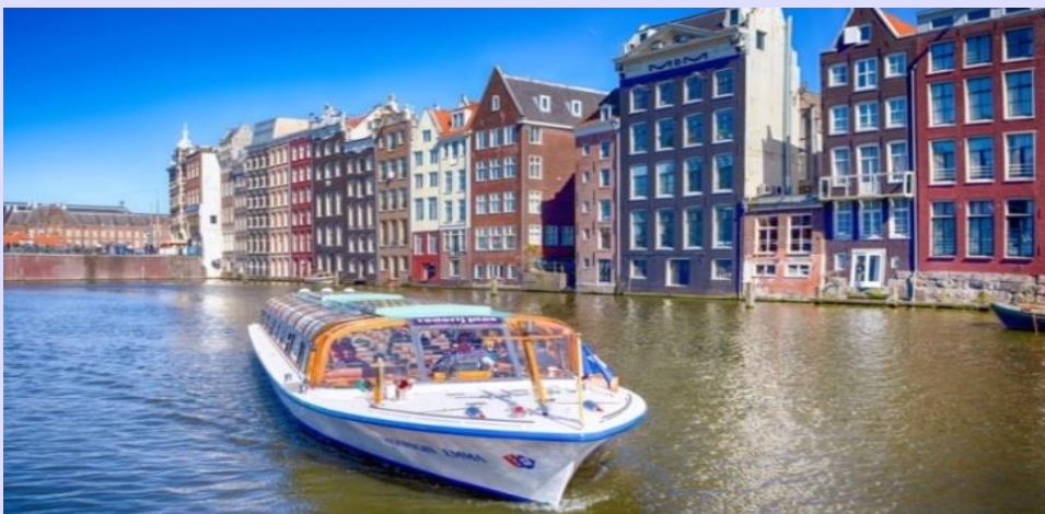
6 | รูปภาพประกอบใช้เพื่อการโฆษณาเท่านั้น

ได้เวลาสมควรนำท่านเดินทางกลับสู่ กรุงอัมสเตอร์ดัม นำท่าน ล่องเรือหลังคากระจก (CANAL CRUISE) ที่เที่ยวชม เมืองอัมสเตอร์ดัม (AMSTERDAM) ที่ตั้งอยู่ริมฝั่งแม่น้ำอัมสเทล (Amstel) เริ่มก่อตั้งประมาณคริสต์ศตวรรษที่ 12 ปัจจุบันเป็นเมืองที่ใหญ่ที่สุดของเนเธอร์แลนด์ มีประชากรในเขตตัวเมืองประมาณ 742,000 คนชมสภาพเมืองที่มีคลองเล็กคลองน้อยตัดไปมาทั่วเมืองอย่างเป็นระเบียบกว่า 100 สาย ชมสถานที่สำคัญที่เรียงรายตามแนวคลอง รวมถึงเพลิดเพลินไปกับการชมความสวยงามของอาคารบ้านเรือนในยุคทองของสถาปัตยกรรมดัตช์ที่ถูกจัดให้เป็นมรดกโลกจากองค์การยูเนสโก พร้อมคำบรรยายเป็นภาษาไทย จากนั้นนำคณะเข้าชม สถาบันเจียรไนเพชร (COSTER DIAMOND) อุตสาหกรรมการเจียรไนเพชรของเนเธอร์แลนด์ได้รับการยกย่องว่าดีที่สุดในแห่งหนึ่งของโลก ชมขั้นตอน การคัดเลือกเพชรโดยละเอียดจากวิทยากรผู้ชำนาญตลอดจนขั้นตอนการเจียรไนเพชรให้เป็นอัญมณีที่มีค่าที่สุดสำหรับท่านที่ต้องการเป็นเจ้าของอัญมณีล้ำค่า เลือกซื้อตามชอบใจพร้อมใบการันตี Certificate จากสถาบัน