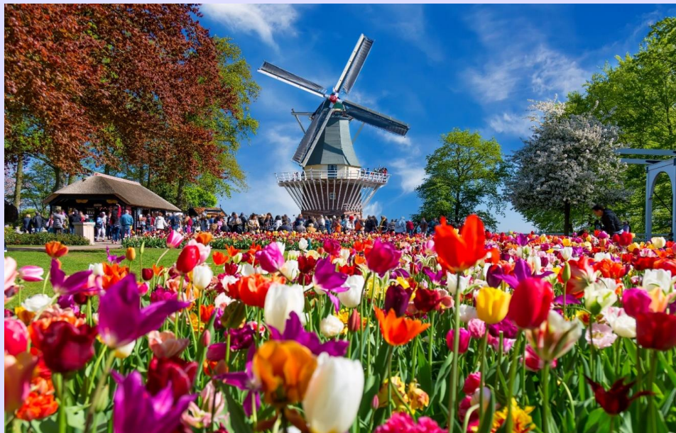
7 | รูปภาพประกอบใช้เพื่อการโฆษณาเท่านั้น

นำท่านเดินทางสู่ เมืองลิชเช่ (LISSE) (ใช้เวลาเดินทางประมาณ 20 นาที) หนึ่งในเมืองท่องเที่ยวสำคัญในฤดูใบไม้ผลิ เนื่องจากเป็นที่ตั้งของสวนเคอเคนฮอฟ สถานที่จัดงานเทศกาลดอกทิวลิป และ ดอกไม้สีสันสดใส ซึ่งจะจัดเพียงปีละครั้งเท่านั้น นำท่านเข้าชมเทศกาลดอกไม้ระดับโลก ณ สวนเคอเคนฮอฟ (KEUKENHOF) เป็นสวนดอกไม้สำคัญของเนเธอร์แลนด์ และเป็นหนึ่งในสวนดอกไม้ที่ใหญ่ที่สุดในโลก ด้วยเนื้อที่กว่า 200 ไร่ ตั้งอยู่ใน เมืองลิชเช่ (LISSE) แคว้นเซาท์ฮอลแลนด์ (SOUTH HOLLAND) ซึ่งความพิเศษของสวนดอกไม้แห่งนี้คือ นอกจากจะเป็นแหล่งเพาะพันธุ์ ดอกทิวลิป ที่สำคัญของเนเธอร์แลนด์แล้ว ยังเป็นสวนที่เปิดให้เข้าชมเฉพาะฤดูใบไม้ผลิ ตั้งแต่ปลายเดือนมีนาคม-พฤษภาคมของทุกปี ภายในสวนนั้นมีดอกทิวลิปกว่า 800 สายพันธุ์ แต่ละสายพันธุ์ต่างมีเอกลักษณ์และสีสันเฉพาะตัว ที่แม้จะมีความคล้ายคลึงกันอยู่บ้าง แต่ก็มีความแตกต่างที่เด่นชัดกันออกไป เมื่อเข้าสู่ฤดูใบไม้ผลิ ดอกทิวลิปเหล่านี้ก็จะพากันเบ่งบาน ระเบิดสีสันออกมาทั่วทั้งสวนไปพร้อมๆ กับดอกไม้ชนิดอื่นๆ เช่น ดอกกลีบลี ดอกแดฟโฟดิล หรือนาซิสซัส ดอกไฮยาซินธ์ ดอกซากุระ และ ดอกกล้วยไม้ อีกหลากหลายสายพันธุ์