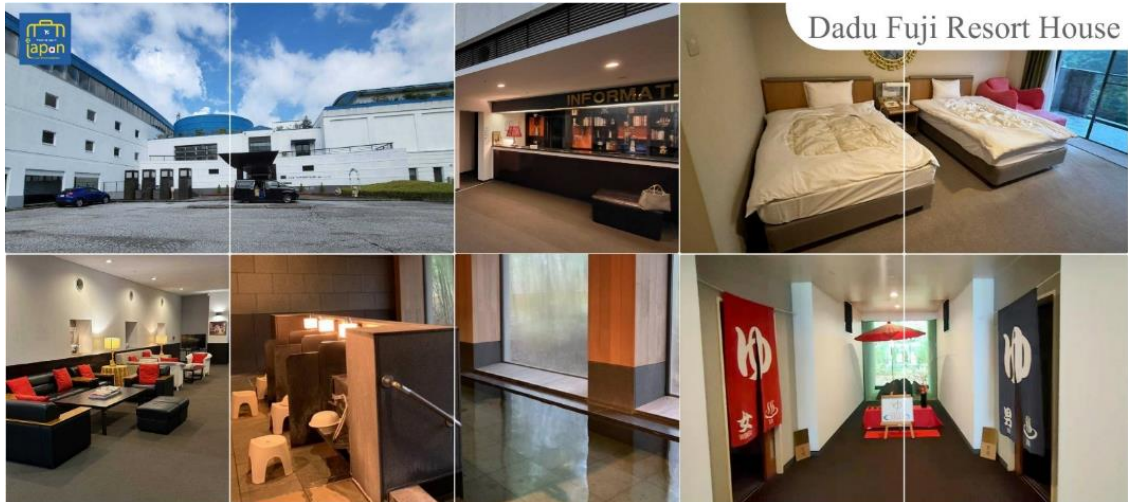
Dadu Fuji Resort House

หลังอาหารให้ท่านได้ผ่อนคลายกับการแช่น้ำแร่ธรรมชาติ เชื่อว่าถ้าได้แช่น้ำแร่แล้ว จะทำให้ผิวพรรณสวยงามและช่วยให้ระบบหมุนเวียนโลหิตดีขึ้น