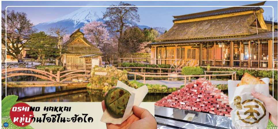
OSHINO HAKKAI หมู่บ้านโอชิโนะฮักไก

ใช้เวลาอันสมควรนำท่านเดินทางสู่ จังหวัดยามานาชิ (Yamanashi) (ใช้เวลาเดินทางประมาณ 2-3 ชั่วโมง) นำท่านเดินทางสู่ หมู่บ้านโอชิโนะฮักไก (Oshino Hakkai) ให้ท่านเจาะลึกตามหาแหล่งน้ำบริสุทธิ์จากภูเขาไฟฟูจิ ที่เป็นแหล่งน้ำตามธรรมชาติตั้งอยู่ในหมู่บ้านโอชิโนะ จ.ยามานาชิ หรือพูดในทางกลับกันคือกลุ่มน้ำผุดโอชิโนะฮักไก เพียงก้าวแรกที่ย่างเท้าเข้าไปในหมู่บ้านก็สัมผัสได้ถึงอากาศบริสุทธิ์ และไอเย็นจากแหล่งน้ำธรรมชาติที่มีให้เห็นอยู่ทุกมุม โดยในบ่อน้ำใสแจ๋วมีปลาหลากหลายพันธุ์แหวกว่ายอย่างสบายอารมณ์ แต่ขอบอกเลยว่าน้ำแต่ละบ่อนั้นเย็นจับใจจนแอบสงสัยว่าน้องปลาไม่หนาวสะท้านกันบ้างหรือ เพราะอุณหภูมิในน้ำเฉลี่ยอยู่ที่ 10-12 องศาเซลเซียสนอกจากชมแล้วก็ยังมีน้ำผุดจากธรรมชาติให้ดักดื่มตามอัธยาศัย และที่สำคัญ หมู่บ้านโอชิโนะยังเป็นแหล่งช้อปปิ้งสินค้าโอท็อปชั้นเยี่ยมอีกด้วย