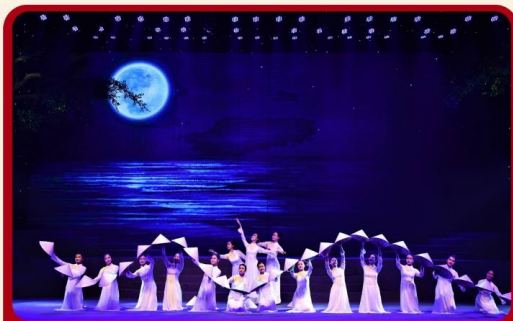
ชม CHARMING SHOW