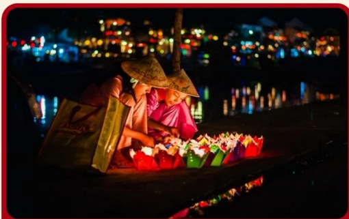
ล่องเรือลอยกระทงที่ฮอยอัน