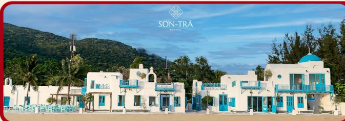
ซีคอนคาเฟ่ SON TRA MARINA