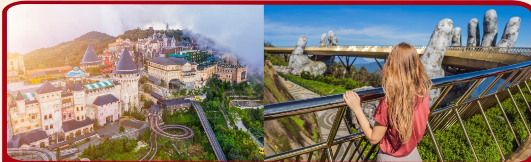
เที่ยวบานาฮิลล์เต็มวัน แบบจุใจ