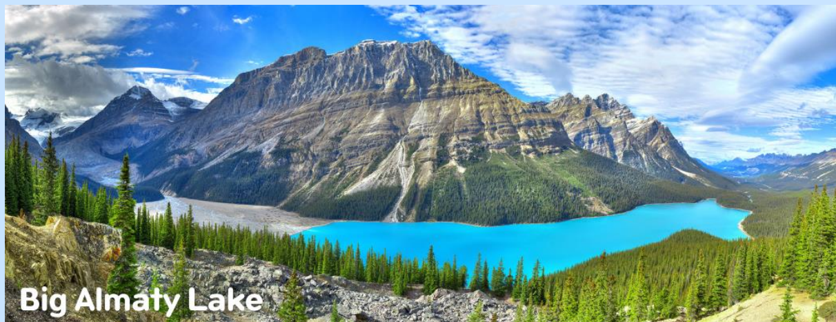
Big Almaty Lake

เช้า รับประทานอาหารเช้า ณ ห้องอาหารโรงแรม