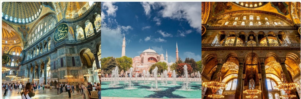
หน้า 13 (ภาพใช้เพื่อการโฆษณาเท่านั้น)

จากนั้นนำทุกท่านแวะถ่ายรูปบริเวณโดยรอบและด้านหน้า สุเหร่าเซนต์โซเฟีย (SAINT SOPHIA) หรือ โบสถ์ฮาเจีย โซเฟีย ใน 7 สิ่งมหัศจรรย์ของโลกยุคกลาง ปัจจุบันเป็นที่ประชุมสวดมนต์ของชาวมุสลิม ในอดีตเป็นโบสถ์ทางศาสนาคริสต์พระเจ้าจักรพรรดิคอนสแตนติน เป็นผู้สร้างเมื่อประมาณคริสต์ศตวรรษที่ 13 ใช้เวลาสร้าง 17 ปี เพื่อเป็นโบสถ์ของศาสนาคริสต์แต่ถูกผู้ก่อการร้ายบุกทำลายเผาเสียหลายครั้งเพราะเกิดการขัดแย้งระหว่างพวกที่นับถือศาสนาคริสต์กับศาสนาอิสลามจวบจนถึงรัชสมัยของ พระเจ้าจัสตินเนียนมีอำนาจเหนือตุรกีจึงได้สร้าง โบสถ์เซนต์โซเฟีย ขึ้นใหม่ ใช้เวลาสร้างฐานโบสถ์ 20 ปี ตัวโบสถ์ 5 ปี เมื่อประมาณปี พ.ศ. 1996 (ค.ศ 1435) พระองค์ต้องการให้เป็นสิ่งสวยงามที่สุดได้พยายามหา สิ่งของมีค่าต่าง ๆ มาประดับไว้มากมาย สร้างเสร็จได้มีการเฉลิมฉลองกันอย่างมโหฬารต่อมาเกิดแผ่นดินไหวอย่างใหญ่ทำให้แตกร้างต้องให้ช่างซ่อมจนเรียกขานในสภาพเดิมเมื่อสิ้นสมัยของจักรพรรดิจัสตินเนียน ถึงสมัย พระเจ้าโมฮัมหมัดที่ 2 มีอำนาจเหนือตุรกี และเป็นผู้นับถือศาสนาอิสลามจึงได้ดัดแปลงโบสถ์หลังนี้ให้เป็นสุเหร่าของชาวมุสลิม