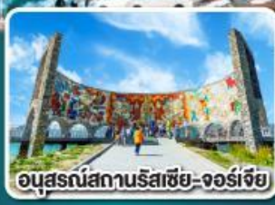
อนุสรณ์สถานริสเซีย-จอร์เจีย