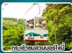
กระเช้าชมสวนบอร์โจมี