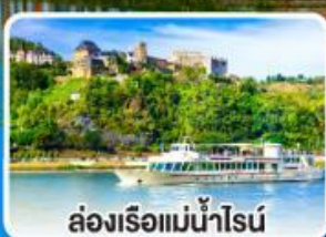
ล่องเรือแม่น้ำไรน์