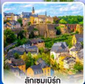
ลักเซมเบิร์ก