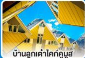
บ้านลูกเต่าโคทคูมูส

ล่องเรือ... ชมทัศนียภาพอันสวยงาม ตลอดสองฟากฝั่งของแม่น้ำไรน์