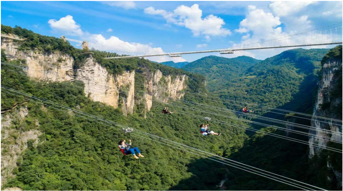
จากนั้นนำท่าน สไลเดอร์กระจกชมธรรมชาติ ความยาว 500 เมตร สไลด์จากบนเขาสูงลัดเลาะตามทาง สภาพเขาจนมาสู่ตีนเขา ให้เราได้ย่อนวัยความทรงจำแสนสนุกในวันเด็ก กับสไลด์ที่ไม่เหมือนใครในธรรมชาติ ที่สวยงาม