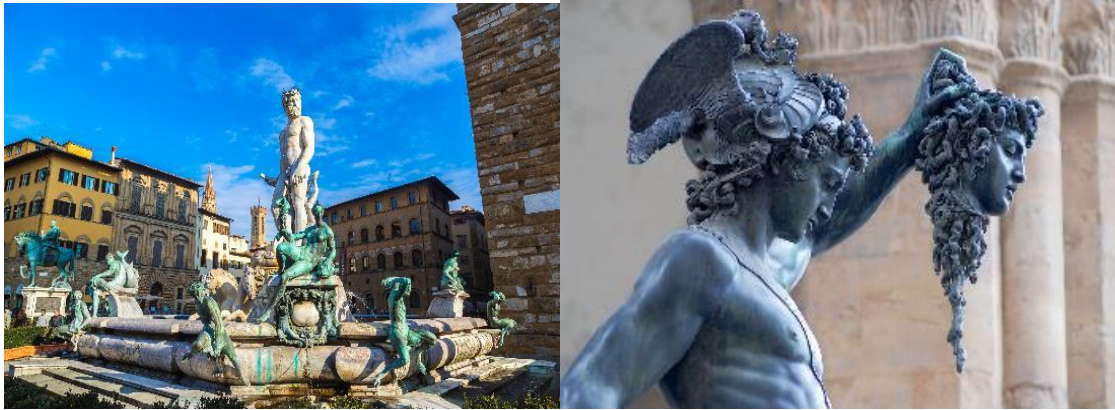
คำ อิสระอาหารเพื่อความสะดวกในการท่องเที่ยว พักที่ DATINI HOTEL , PRATO ระดับ 4 ดาวหรือเทียบเท่า

นำท่านเดินเที่ยวชมเมืองเก่า ฟลอเรนซ์ (FLORENCE) นำชมจัตุรัสเตลลาซิญญูเรีย (PIAZZA DELLA SIGNORIA) ซึ่งรายล้อมไปด้วยรูปปั้น อาทิ เช่น รูปปั้นเทพเจ้าเนปจูน (FOUNTAIN OF NEPTUNE), วีรบุรุษเปอร์ซิอุสถือหัวเมดูซ่า (PERSEUS WITH THE HEAD OF MEDUSA), รูปปั้นเดวิด ผลงานที่มีชื่อเสียงของ ไมเคิล แองเจโล่ จากนั้นนำท่านชมความยิ่งใหญ่ และอลังการของ มหาวิหารซานตา มาเรีย เดล ฟิโอเร (SANTA MARIA DELL FIORE) วิหารของเมืองฟลอเรนซ์ ที่ใหญ่เป็นอันดับ 4 ของทวีปยุโรป ซึ่งโดดเด่นด้วยสถาปัตยกรรมที่ใช้หินอ่อนหลายสีตกแต่งผสมผสานกันได้อย่างงดงาม