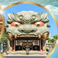
ศาลเจ้าอามะยะซากะ