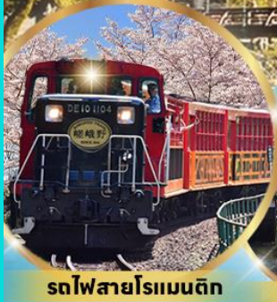
รถไฟสายโรแมนติก