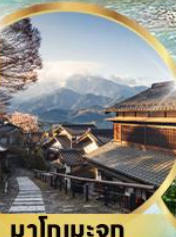
มาโทเมะจุกุ