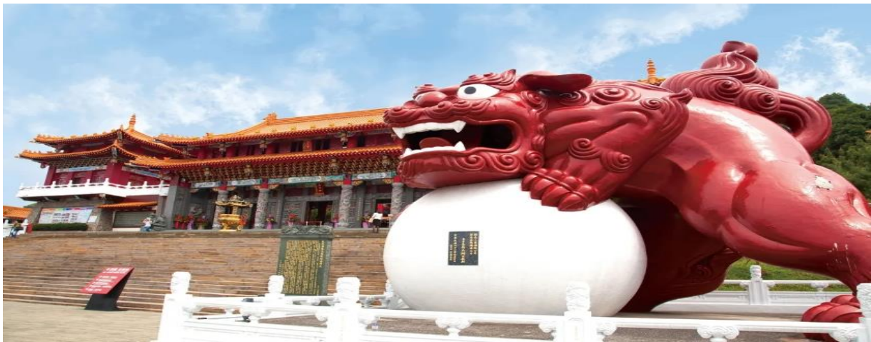
GO1CNXTP-E-JX004 ไปแล้วกันเด้อะ บินตรง เชียงใหม่ ไต้หวัน เที่ยวบิน 6 วัน 5 คืน STARLUX (JX)

นำท่านเดินทางสู่ วัดเหวินหวู่ Wenwu Temple หรือ วัดกวนอู ตั้งอยู่ระหว่างเขาทางทิศเหนือของทะเลสาบสุรียันจันตรา สร้างขึ้นเมื่อปี ค.ศ. 1938 เป็นวัดศักดิ์สิทธิ์อีกแห่งหนึ่งของไต้หวัน แต่เดิมในอดีตริมฝั่งทะเลสาบสุรียันจันตราเป็นที่ตั้งของ 2 วัดเก่า คือวัดหลงฟิงและวัดหัวถั่ง ต่อมาเมื่อญี่ปุ่นได้เข้ายึดครองเกาะไต้หวันและได้สร้างเขื่อนผลิตไฟฟ้าบริเวณทะเลสาบสุรียันจันตราในปีค.ศ. 1934 ส่งผลให้ระดับน้ำในทะเลสาบเพิ่มสูงขึ้นจนท่วมวัดเก่าทั้ง 2 แห่ง ทางญี่ปุ่นจึงได้จ่ายค่าชดเชยให้ทางการไต้หวันโดยการสร้างวัดแห่งใหม่ขึ้นบนไหล่เขาทางตอนเหนือของทะเลสาบแทนวัดเก่าทั้งสองที่เสียหายจากน้ำท่วมจึงเป็น วัดเหวินหวู่ ในปัจจุบัน สถาปัตยกรรมของวัดนี้เต็มไปด้วยงานแกะสลักหินจำนวนมากรวมถึงสิงโตหินอ่อน 2 ตัว ที่ตั้งอยู่บริเวณด้านหน้าของวัดซึ่งมีมูลค่าตัวละ 1 ล้านบาทโดยไต้หวันโดยตัววิหารใหญ่แบ่งออกเป็นสามชั้นและมีวิหารเล็กโอบล้อมอยู่ด้านข้าง