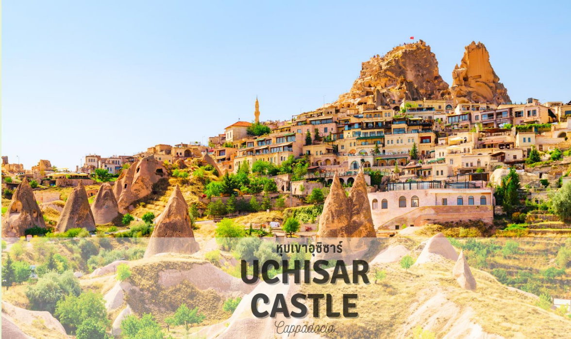
หุบเขาอุซิชาร์ UCHISAR CASTLE Cappadocia

แนวถ่ายรูป หุบเขาอุซิชาร์ (UCHISAR VALLEY) หุบเขาล้ำยอดปลวกขนาดใหญ่ ใช้เป็นที่อยู่อาศัย ซึ่งหุบเขาตั้งสูงกว่ามีรูพรุน มีรอยเจาะรอยซุด อันเกิดจากฝีมือมนุษย์ไปเกือบทั่วทั้งภูเขา เพื่อเอาไว้เป็นที่อยู่อาศัย