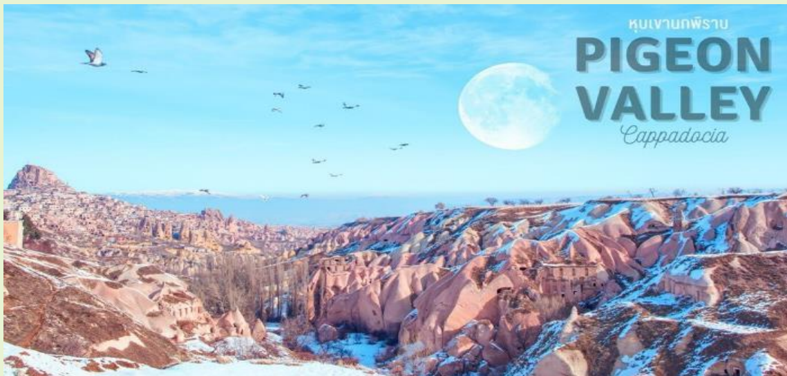
หุบเขากพิราบ PIGEON VALLEY Cappadocia

นำท่านชม หุบเขากพิราบ (PIGEON VALLEY) จุดชมวิวยู่ตรงบริเวณหน้าผาที่ชาวเมืองโบราณได้ขุดเจาะเป็นรู เพื่อให้นกพิราบเข้าไปทำรังอาศัยอยู่ ชาวบ้านเลี้ยงนกพิราบไว้เพื่อนำมูลมาทำเป็นปุ๋ยบำรุงต้นไม้ จากจุดชมวิวสามารถมองเห็นปราสาทอุซิชาร์ (USHISAR CASTLE) และยังมีต้นไม้จำลองที่เต็มไปด้วยดวงตาสีฟ้าแขวนอยู่โดดเด่น อีสรระถ่ายภาพตามอัธยาศัย