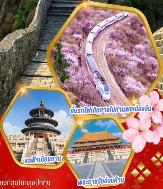
ขัั้นรถไฟเดินทางไปท่าอากาศยานเมืองจีน