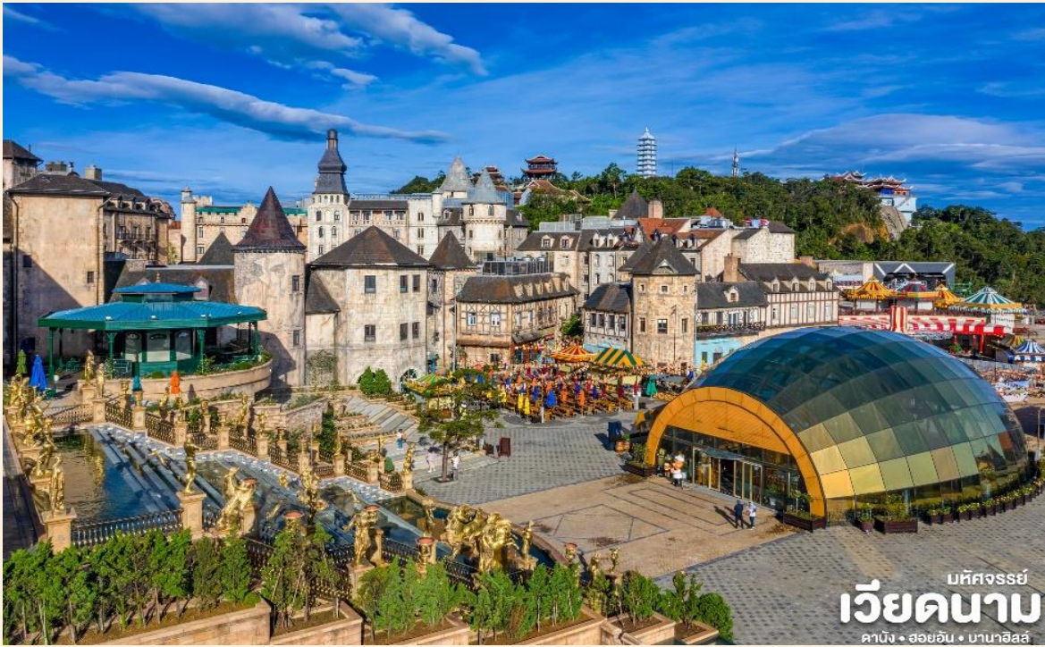
บัทคองรย์ เวียดนาม ดานัง • ฮอยอัน • บานาฮิลล์

📍 นำทุกท่านเดินทางสู่ บานาฮิลล์ เป็นที่ตากอากาศที่ดีที่สุดในเวียดนามกลางได้ค้นพบในสมัยที่ฝรั่งเศสเข้ามาปกครองเวียดนามได้มีการสร้างถนนอ้อมขึ้นไปบนภูเขาสร้างที่พักโรงแรมสิ่งอำนวยความสะดวกต่างๆเพื่อใช้เป็นสถานที่พักผ่อนในระหว่างการบรรเทาที่นั้งกระเช้าด้วยความเสียวพร้อมความสวยงามเราจะได้เห็นวิวธรรมชาติที่น้ำตก Toc Tienและลำธาร Suoi no (ในฝัน)