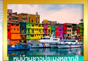
หมู่บ้านชาวประมงหลากสี