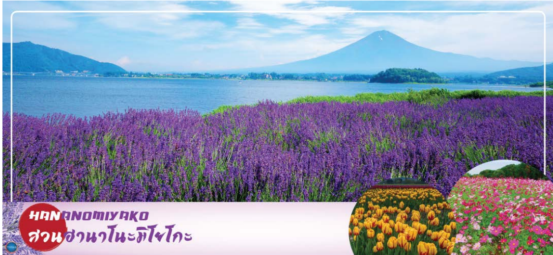
HANANOMIYAKO สวนसानะโนะมิยาโกะ

วันที่สาม เมืองยามานาชิ – สวนดอกไม้सानะโนะมียาโกะ หรือ เทศกาลชมดอกกลาเวนเดอร์ที่ทะเลสาบคาวากุจิ (ตามฤดูกาล) – พิธีชงชาญี่ปุ่น – กรุงโตเกียว – ย่านโอไดบะ – ห้างไดเวอร์ซิตี – เมืองนาริตะ – อีออนมอลล์ นาริตะ