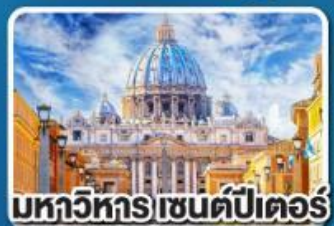
มหาวิหาร เซนต์ปีเตอร์