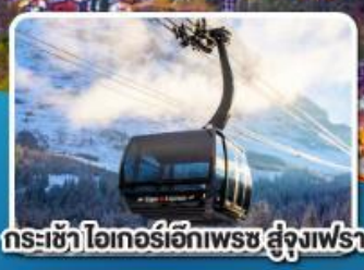
กระเช้า ไอเกอร์เอ็กเพรส สู่อยอดเขาจุงเฟรา

อิตาลี สวิตเซอร์แลนด์ ฝรั่งเศส 10 วัน 7 คืน