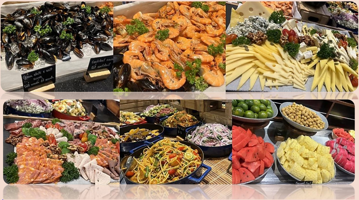
ที่พัก โรงแรม Mercure Danang French Village Bana Hills

* ในกรณีที่ผู้เข้าพักบนบานาฮิลล์มีจำนวนผู้เข้าพักทั้งหมดไม่ถึง 80-100 คน ขึ้นไป จะได้รับเป็นเซตเมนู *