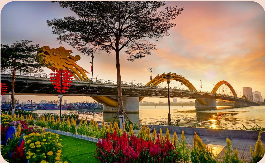
GO1DAD-VZ101 GO VIETNAM ดานัง บานาฮิลล์ ฮอยอน 4 วัน 3คน (พักบานาฮิลล์ 1 คน , ดานัง 2 คน) โดยสายการบิน VietJet Air (VZ)

นำท่านชม สะพานมังกร (Dragon Bridge) สะพานข้ามแม่น้ำสายหลักของเมืองอย่าง “แม่น้ำฮาน” ถูกสร้างขึ้นเพื่อเป็นจุดเชื่อมต่อสำคัญด้านเศรษฐกิจ และกลายเป็นแหล่งท่องเที่ยวที่มีชื่อเสียงของเมืองดานัง เป็นสัญลักษณ์ของการฟื้นฟูประเทศและเศรษฐกิจ เปิดใช้งานตั้งแต่ปี 2013 ท่านสามารถเดินไปยัง สะพานแห่งความรัก สะพานที่ถูกตกแต่งด้วยเสารูปหัวใจทอดยาวลงสู่แม่น้ำฮาน เมื่อเดินลงไปท่านจะสามารถเห็นวิวของสะพานมังกรได้อย่างสวยงาม รวมไปถึงในบริเวณนั้นจะมีรูปปั้นปลามังกรพ่นน้ำ ที่ถือได้ว่าเป็นอีกสัญลักษณ์หนึ่งของเมืองดานังถ่ายภาพเป็นที่ระลึกตามอัธยาศัย