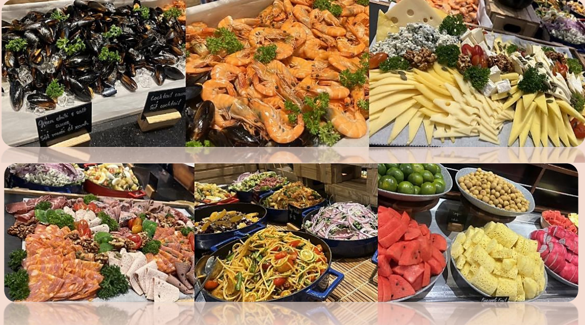
ที่พัก โรงแรม Mercure Danang French Village Bana Hills

คำ รับประทานอาหารค่ำ ณ ภัตตาคารบนบานาฮิลล์ อาหารบุฟเฟ่ต์นานาชาติ (มือที่ 2) * ในกรณีที่ผู้เข้าพักบนบานาฮิลล์มีจำนวนผู้เข้าพักทั้งหมดไม่ถึง 80-100 คน ขึ้นไป จะได้รับเป็นเซตเมนู *