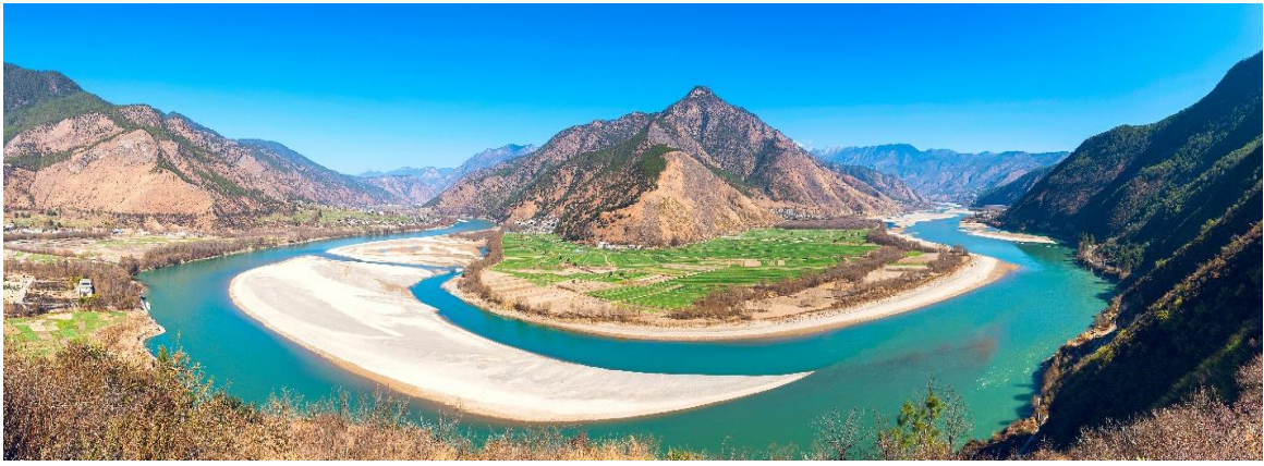
จากนั้นชมวิว ช่องแคบเสือกระโจน (รวมบันไดเลื่อนขึ้น-ลง) ซึ่งเป็นช่องแคบช่วงแม่น้ำแยงซีไหลลงมาจากจินซาเจียง(แม่น้ำทรายทอง) เป็นช่องแคบที่มีน้ำไหลเชี่ยวมาก ช่วงที่แคบที่สุดประมาณ 30 เมตร ตามตำนานเล่าว่า ในอดีตช่องแคบเสือนี้สามารถกระโดดข้ามไปยังฝั่งตรงข้ามได้ จึงเป็นที่มาของ “ช่องแคบเสือกระโจน”