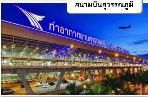
สนามบินสุวรรณภูมิ

เวลา 21.00 น. พร้อมกันที่ ท่าอากาศยานสุวรรณภูมิ อาคารผู้โดยสารขาออกระหว่างประเทศ เคาน์เตอร์ F สายการบินไทยแอร์เอเชีย เอ็กซ์ เจ้าหน้าที่คอยให้การต้อนรับ ดูแลด้านเอกสาร เช็คอิน และสัมภาระในการเดินทาง