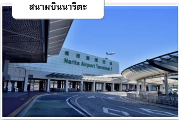
สนามบินนาริตะ

เวลา 08.00 น. เดินทางถึง สนามบินนาริตะ นำท่านผ่าน ขั้นตอนการตรวจคนเข้าเมืองและศุลกากร