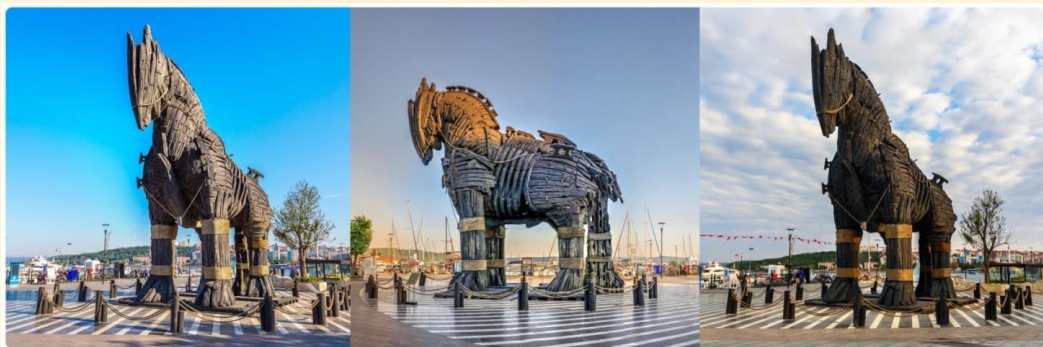
หน้า 11 (ภาพใช้เพื่อการโฆษณาเท่านั้น)

จากนั้นนำท่านถ่ายรูปกับ ม้าไม้จำลองกรุงทรอย HOLLYWOOD TROY WOODEN HORSE ซึ่งอยู่ใจกลางเมืองชานัคคาเล่ ม้าไม้เมืองทรอยตามเรื่องเล่านั้นเกิดจากการต่อสู้ระหว่างกองทัพกรีกและกรุงทรอย ต่อสู้กันนานนับสิบปี กองทัพกรีกจึงคิดแผนการที่จะตีกรุงทรอยโดยการสร้างม้าไม้ โดยทหารกรีกได้เข้าไปซ่อนตัวอยู่ในช่องต่างๆของม้าและเข้าไปไว้หน้าเมืองทรอย ชาวเมืองทรอยเห็นก็นึกว่ากองทัพกรีกได้ถอยทัพยอมแพ้ไปแล้วและมอบม้าไม้จำลองเป็นของขวัญ จึงเชิญเข้าไปไว้ในเมือง ตกกลางคืนชาวทรอยนอนหลับหมด ทหารที่ซ่อนอยู่ในม้าก็ออกมาเปิดประตูให้กองทัพกรีกเข้ามาทำการยึด และเผากรุงทรอยจนย่อยยับ ซึ่งม้าไม้จำลองแห่งเมืองทรอยที่เห็นอยู่ในเมือง ชานัคคาเล่ นี้ได้รับมาจาก กองถ่ายทำละคร