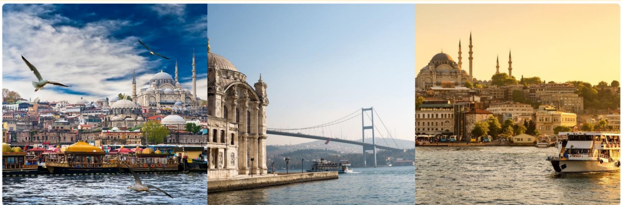
หน้า 15 (ภาพใช้เพื่อการโฆษณาเท่านั้น)

เช้า 📍 บริการอาหารเช้า ณ ห้องอาหารของโรงแรม นำทุกท่าน ล่องเรือช่องแคบบอสฟอรัส จุดที่บรรจบกันของทวีปยุโรปและเอเชีย ซึ่งทำให้ประเทศตุรกีได้รับสมญานามว่า ดินแดนแห่งสองทวีป ช่องแคบบอสฟอรัสยังเป็นจุดยุทธศาสตร์สำคัญเนื่องจากเป็นเส้นทางเดินเรือที่เชื่อมทะเลดำทะเลมาร์มาร่า เราจะได้เห็นป้อมปืนที่ตั้งเรียงรายอยู่ตามช่องแคบได้แก่ Rumeli Castle และ Anatolia Castle โดยจุดชมวิวที่สำคัญคือสะพาน ขวอนบอสฟอรัส เชื่อให้รถยนต์สามารถวิ่งข้ามฝั่งยุโรปและเอเชียได้ สร้างเสร็จในปี ค.ศ.1973 มีความยาวทั้งสิ้น 1,560 เมตร และได้กลายเป็นสะพานแขวนที่ยาวเป็นอันดับ 4 ของโลกในสมัยนั้น (ปัจจุบันตกไปอยู่อันดับที่ 21) ขณะที่ล่องเรือพร้อมดื่มด่ำกับบรรยากาศสองข้างทาง ซึ่งสามารถมองเห็นได้ไม่ว่าจะเป็นพระราชวังโดลมาบาเช่และบ้านเรือนของบรรดาเหล่าเศรษฐีที่สร้างได้สวยงามตระการตา