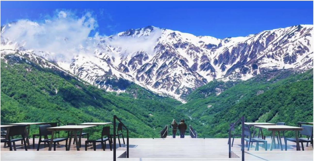
HAKUBA MOUNTAIN HARBOR

ไม่พลาดกับการชมวิวแบบพาโนรามา ณ Hakuba Mountain Harbor ด้วยทัศนียภาพที่เหนือ ชั้นของภูเขาโดยรอบ จุดเด่น คือ ระเบียง “Hakuba Sanzan” ที่สามารถเห็นเทือกเขาแอลป์แบบ 360 องศา ได้อย่างสวยงามในทุกฤดู สามารถยืนถ่ายรูป และดื่มด่ำกับบรรยากาศได้อย่าง เต็มอิม ในบริเวณเดียวกันยังมีร้านเบเกอรี่ โดยทางเข้ามีที่นั่งบนระเบียง สามารถเพลิดเพลิน ไปกับการจิบเครื่องดื่มอุ่น ๆ พร้อมชมบรรยากาศตามอัธยาศัย