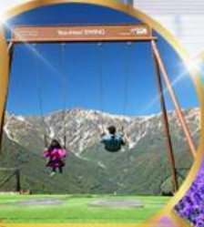
ชิงช้า Yoo hoo! Swing