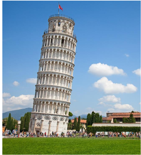
Highlight ! หอเอนปิซาเคยเป็นสถานที่กาลิเลโอพิสูจน์เรื่องแรงโน้มถ่วงของโลก และการตกของวัตถุ

เช้า 🍴 รับประทานอาหารเช้า ณ โรงแรม (มื้อที่3) นำท่านเก็บภาพความประทับใจและถ่ายรูป 1 ใน 7 สิ่งมหัศจรรย์ของโลก หอเอนปิซา (Leaning Tower of Pisa) หอเอนปิซาที่สร้างขึ้นเพื่อเป็นหอระฆังแห่งวิหารประจำเมือง แต่เพียงการเริ่มต้นของการสร้างถึงบริเวณชั้น 3 ก็เกิดการทรุดตัวและต้องหยุดการก่อสร้างจนถดถูมาอีก 100 ปี ถึงได้สร้างต่อจนเสร็จสมบูรณ์ มหาวิหารปิซา (Cathedral of Pisa) มหาวิหารที่สวยงามที่สุดในลักษณะโรมันเนสก์ แสดงให้เห็นจากชายหอศิลป์จุ่ม กลางตัวมหาวิหาร และชาวหอระฆัง ตัวมหาวิหารเป็นผังกางเขน มีมุขท้ายวัด และตกแต่งซุ้มโค้งรอบวัดภายนอกเป็นแบบแถบหินอ่อน สลับสีทางขวาง ซึ่งกลายมาเป็นแบบที่เรียกว่า "ลักษณะปิซา" และโดมรูปไข่ และ Pisa Baptisty of St. John เป็นอาคารทางศาสนาคริสต์นิกายโรมันคาทอลิก