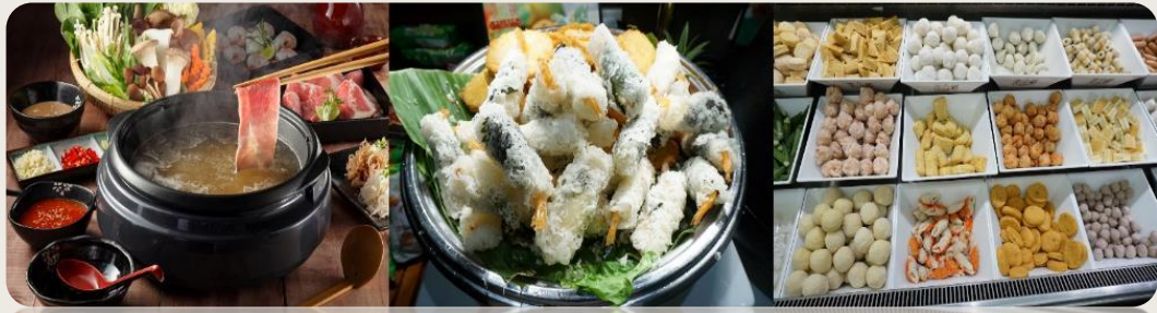
กลางวัน รับประทานอาหารกลางวัน ณ ภัตตาคาร (มื้อที่ 6)