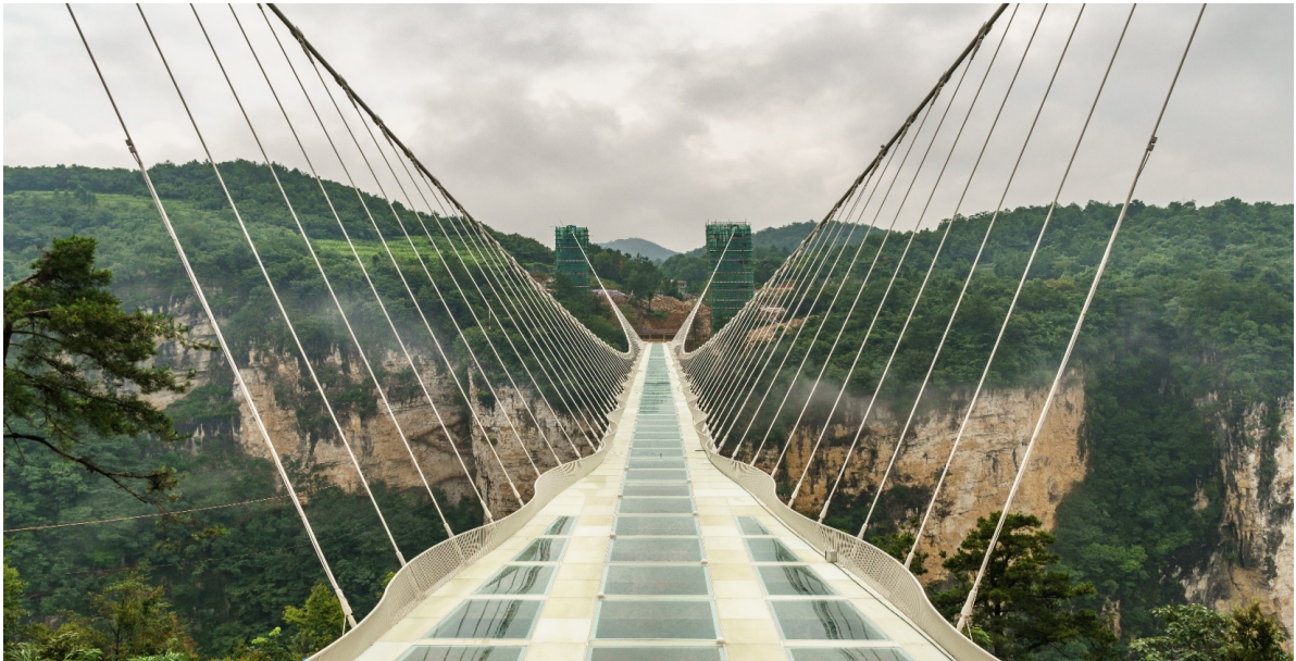
SHSLCSX5 จางเจียเจีย เขาอวดดาว ฟังหวง ฟู่หรงเจิ้น ฉางซา 6 วัน 5 คืน เม.ย.67 SL(130324)

นำท่านพิสูจน์ความกล้ากับ สะพานแก้วจางเจียเจีย สะพานแก้วที่ยาวและสูงที่สุดในโลก สามารถรองรับคนได้มากถึง 800 คน อีกทั้งสะพานแห่งนี้มีความยาว 430 เมตร กว้าง 6 เมตร สูง 300 เมตร เชื่อมสองหน้าผา ***โปรดทราบ!! หมายเหตุ : หากสะพานแก้วปิด ไม่สามารถเข้าไปเที่ยวชมได้ ทางบริษัทฯ ขอสงวนสิทธิ์ไม่คืนค่าบริการใดๆ ทั้งสิ้น โดยไม่ต้องแจ้งให้ทราบล่วงหน้า