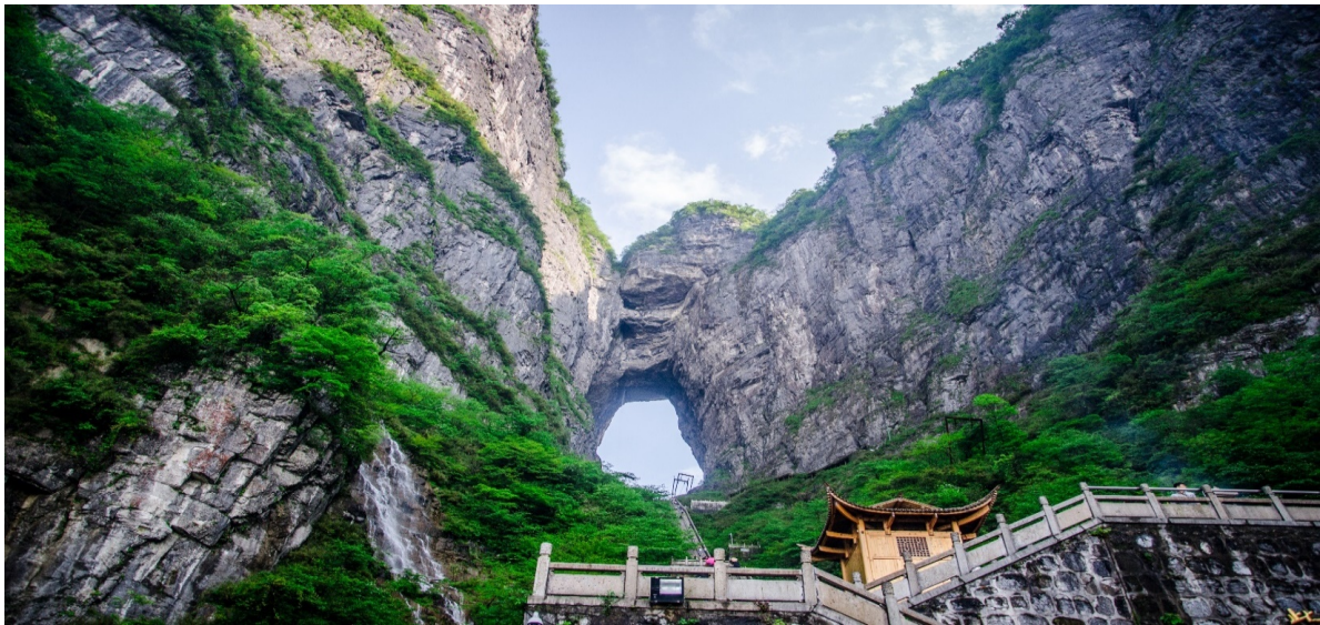
SHSLCSX5 จางเจี๋ยเจี๋ย เขาอวตาร ฟังหวง ฟูหรงเจิ้น ฉางซา 6 วัน 5 คืน เม.ย.67 SL(130324)

***โปรดทราบ!! หมายเหตุ : การนั่งกระเช้าขึ้น-ลง เขาเทียนเหมินซาน หากกระเช้าปิดซ่อมบำรุง ทางบริษัทฯ จะจัดโปรแกรมอื่นมาทดแทนให้ / การนั่งรถ+บันไดเลื่อนของอุทยานขึ้นไปบนถ้ำเทียนเหมินซาน หากรถ+บันไดเลื่อนของอุทยานไม่สามารถขึ้นไปถ้ำเทียนเหมินซานได้ ทางบริษัทฯ จะไม่คืนเงิน หรือหาโปรแกรมอื่นมาทดแทนให้ ทั้งนี้ ขึ้นอยู่กับสภาวะอากาศ และการรักษาความปลอดภัยของนักท่องเที่ยว โดยยึดตามประกาศจากทางอุทยานเป็นสำคัญ โดยที่ไม่แจ้งให้ทราบล่วงหน้า