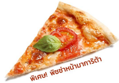
พิเศษ! พิซซ่าหน้ามาการิตา

นำท่านเดินทางสู่ เมืองโคโม (Como) (ระยะทาง 51 กม. / 1 ชม. นาที) ตั้งอยู่บริเวณพรมแดนกับประเทศสวิตเซอร์แลนด์ โคโมเป็นเมืองที่ตั้งอยู่ในเทือกเขาแอลป์ พาทุกท่านไปเก็บภาพความประทับใจกับ ทะเลสาบโคโม (Lake Como) ขึ้นชื่อว่าเป็นทะเลสาบที่สวยงามที่สุดในโลก มีรูปร่างลักษณะเฉพาะของทะเลสาบโคโมทำให้เกิดนิกถึง Y ที่กลับด้านที่โด่งดังไปทั่วโลก เป็นผลมาจากการละลายของธารน้ำแข็งรวมกับการกัดเซาะของแม่น้ำ Adda โบราณ ทำให้เกิดทางแยกเป็นตัวย Y และยังเป็นทะเลสาบมีทิวทัศน์ที่งดงามที่สุดแห่งหนึ่งในโลก