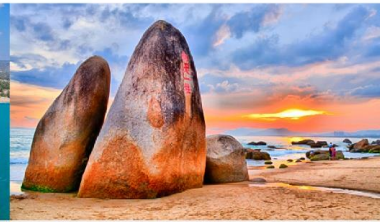
วนอุทยานสุดขอบฟ้า

*ทางบริษัทฯ ขอสงวนสิทธิ์ในการสลับโปรแกรมทัวร์ตามความเหมาะสมขึ้นอยู่กับสถานการณ์หน้างาน โดยคำนึงถึงผลประโยชน์ของลูกค้าเป็นสำคัญ