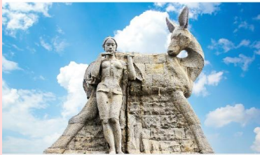
อนุสาวรีย์กวางเหลียวหลั่ง