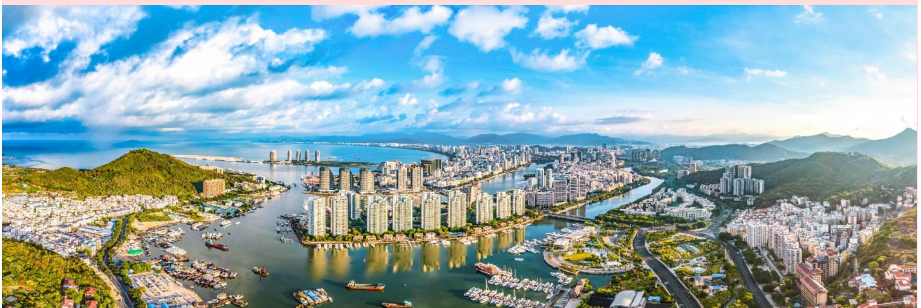
หน้า 6 จาก 18

จากนั้นนำท่านเดินทางสู่ เมืองซานย่า (SANYA) เป็นเมืองที่อยู่ใต้สุดของจีนและเป็นเมืองริมทะเลแห่งเดียวที่ตั้งอยู่ในเขตโซนร้อนของจีน และเป็นเมืองที่สำคัญในการท่องเที่ยวของเกาะไหหลำ (ใช้เวลาเดินทางประมาณ 4 ชั่วโมง)