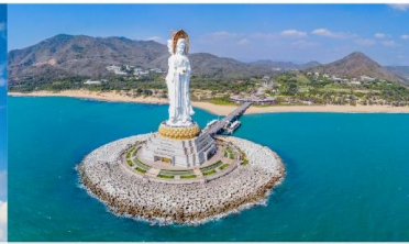
เจ้าแม่กวนอิมหนานชาน